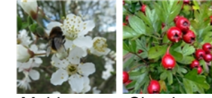
Meidoorn en Sleedoorn