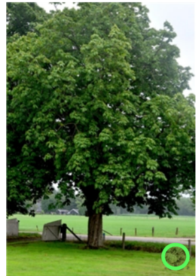
Inheemse eik, Quercus Robur