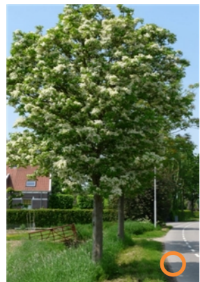
Plumes, Fraxinus ornus