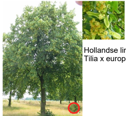
Hollandse linde, Tilia x europaea