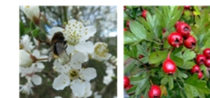
Meidoorn en Sleedoorn