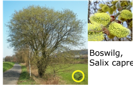
Boswilg, Salix caprea