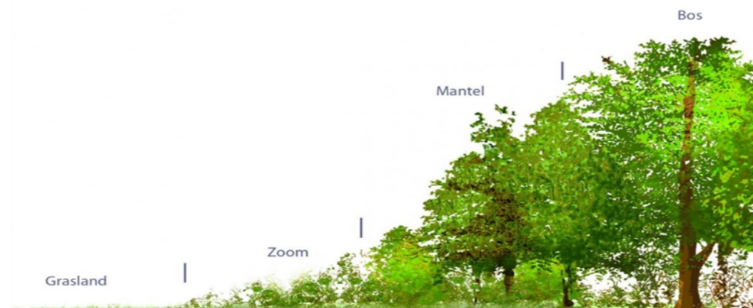
Referentiebeeld opbouw mantel en zoomvegetatie bij het compensatiebos