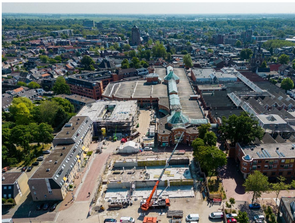
(Luchtfoto Arendsplein, juni 2023)

Het gebouw bestaat in totaal uit vijf verdiepingen en wordt opgetrokken uit een lichte baksteen in combinatie met een chique houten gevelbekleding ter plaatse van de terugliggende bouwlagen. De combinatie van een lichte baksteen met metselwerkaccenten dragen bij aan een kwalitatief hoogwaardig ontwerp op deze centrale plek in Oosterhout. De appartementen variëren in grootte van circa 68 tot 129 m2 woonoppervlak. Op de bovenste bouwlaag worden de royale appartementen voorzien van een riant dakterras. De appartementen worden gekenmerkt door royale livings, ruime slaapkamers en grote balkons. Daarnaast beschikken alle appartementen over een eigen parkeerplaats en privé berging. Om de woning naar eigen wens te personaliseren worden er diverse opties aangeboden."