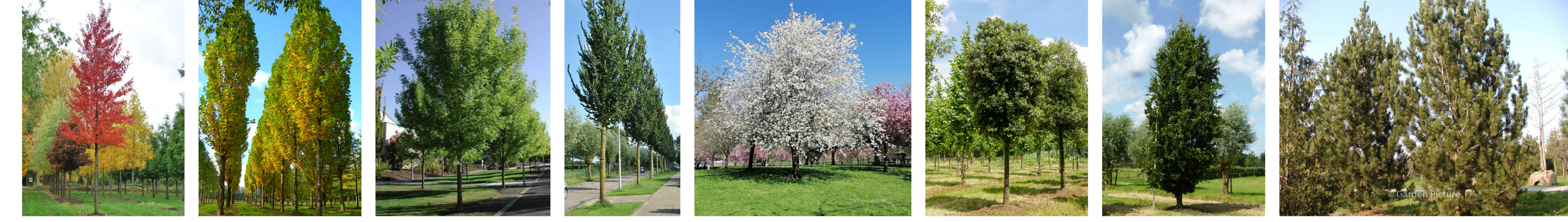
(I) Rode Esdoorn 'Morgan' H: 25-30 m B: 7-10 m (II) Zuil-Tulpenboom H: 10-15 m B: 3-6 m (III) Pensylvanische Es H: 10-16 m B: 7-10 m (IV) Zuil-Heg H: 15-20 m B: 3-6 m (V) Japanse Beverboom H: 6-10 m B: 6-8 m (VI) Steeneik H: 10-15 m B: 12-15 m (VII) Zuilvormige Beuk H: 10-25 m B: 4-5 m (VIII) Den H: 6-10 m B: 3-6 m

BOMEN, met de maximale hoogte (H) en breedte (B) van de boom in volwassen stadium (over ca. 35-40 jaar)