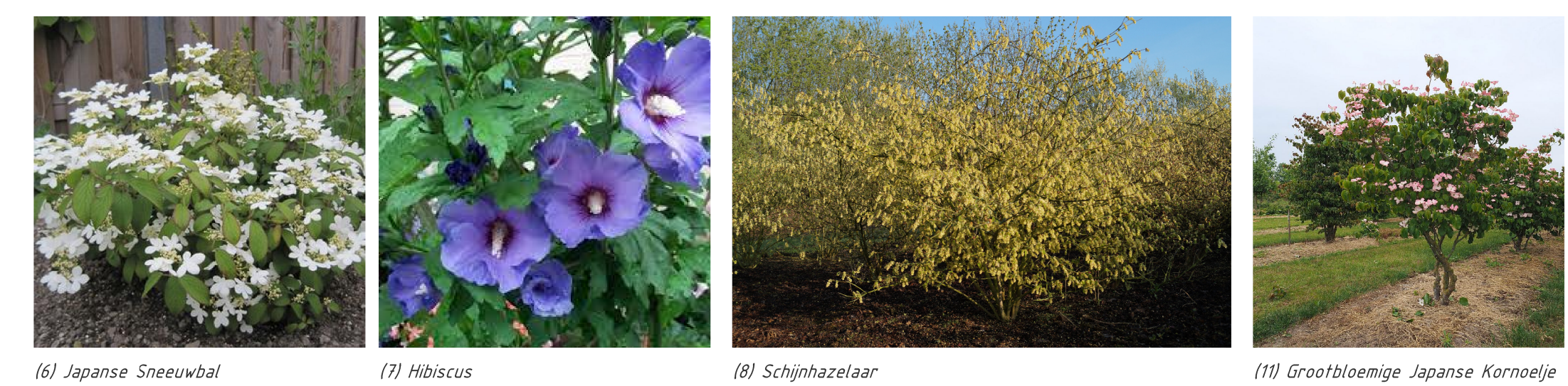
(I) Japanse Sneeuwbal (II) Hibiscus (III) Schijnhazelaar (IV) Grootbloemige Japanse Kornoelje