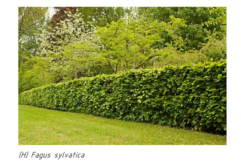
(III) Fagus sylvatica

BOMEN, met de maximale hoogte (H) en breedte (B) van de boom in volwassen stadium (over ca. 35-40 jaar)