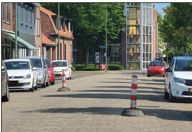
Maatregelen op de Keiweg

Deze maatregelen heeft de gemeente Oosterhout eerder aangebracht op onder andere de Keiweg en de Warandelaan. Daar bleken deze maatregelen effectief te zijn. Dezelfde maatregelen wil de gemeente nu ook op de Vlierlaan aanbrengen. Hieronder ziet u een afbeelding van deze zogenaamde verkeerseilanden.